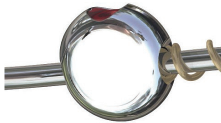
SmartStop mit aktivierter Feder

Die Stoppschraube des SmartJets ist das nächste Element, das in verstärkter Ausführung lieferbar ist. Viele Anwender haben eine Verstärkung der Schraubverbindungen und des Schraubendrehers gefordert.